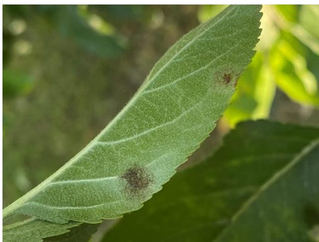
Objawy parcha jabłoni na liściu (u góry) i na zawiązku jabłoni (z prawej).

Ministerstwo Rolnictwa i Rozwoju Wsi cofnęło z dniem 31.03.2021 pozwolenie na handel równoległy czterech środków zawierających difenokonazol, stosowanych do ochrony sadów: Agria Difenokonazol 250 EC, Difenokonazol 250 EC, Skower 250 EC i Sokker 250 EC oraz czterech środków stosowanych do ochrony upraw warzywnych - zawierających azoksystrobinę: Ascom 250 SC, Strobin 250, Tascom 250 SC oraz zawierającego fluazynam – Tamazynam 500 SC .