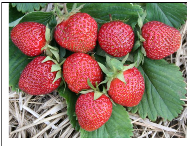
Owoce odmiany 'SELVIK' (Rodowód: 'Selva' x 'Vicoda')