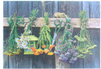
CZAS NA ZIOŁA