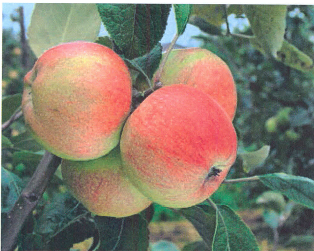
4 'KANTÓWKA GDAŃSKA'

Odmiana zimowa. Doskonała na przetwory, ale także do spożycia w stanie świeżym, lecz nie bezpośrednio po zbiorze. Owoce powinno się przetrzymać w chłodnym pomieszczeniu – wtedy osiągną właściwy smak. Późno kwitnienie, dlatego kwiaty są mniej narażone na przymrozki. Dostyc silnie rośnie, ale jednocześnie daje obfite plony, zwłaszcza na żyznej glebie. Owoce są średniej wielkości, soczyste, słodko-kwaskowate. Dojrzewają pod k. IX. Przerzedzając zawiązki uzyskuje się obfite, coroczne owocowanie. Drzewa są wytrzymałe na mróz, dlatego można je sadzić w rejonach o surowszym klimacie.