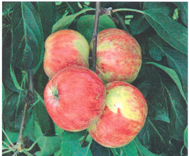
3 'KRÓLOWA RENET' ('Reneta Złota')

Jej owoce uznawane są za uniwersalne, ponieważ nadają się na różnego rodzaju przetwory (np. do produkcji jabłecznika – cydru) a jednocześnie można je jeść na świeżo. Odmiana wymaga żyznych gleb i wilgotnego klimatu (do sadzenia w pobliżu zbiorników wodnych – tam lepiej plonuje). Owoce są średnich rozmiarów lub duże, dojrzewają ok. poł. IX, są soczyste, chrupiące, z nutą ananasową i intensywnym aromatem. Uznawana jest za jedną z najsmaczniejszych odmian jesiennych. Smak rekompensuje umiarkowaną plenność drzew.