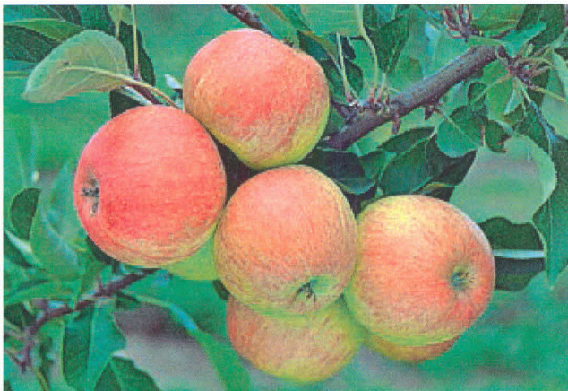
1 'JAMES GRIEVE'

Jedną z ważniejszych cech jest smak owoców. Z reguły przewagę mają odmiany słodko-kwaskowate, o zbalansowanym smaku. Zdecydowanie mniej jest amatorów bardzo słodkich jabłek, najmniej – kwaśnych. Jednak te ostatnie są doskonale do przetwarzania. Ważna jest też podatność na choroby, szczególnie parcha jabłoni. Dodatkowo, owoce wybranych tu odmian można wykorzystać zarówno do spożycia w stanie świeżym, jak i na przetwory. Oto nasze propozycje.