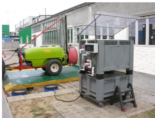
Stanowisko VERTIBAC zintegrowane ze stanowiskiem do mycia opryskiwaczy