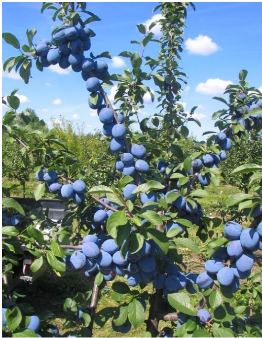
Drzewo odmiany 'Emper'