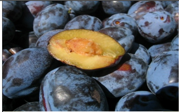
Owoce odmiany 'Emper'