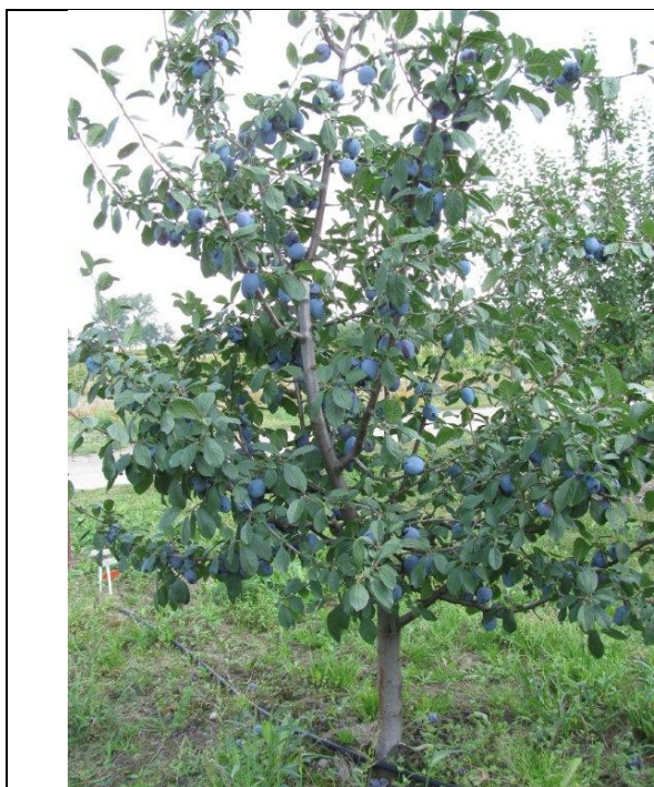
Drzewo odmiany 'Polinka'