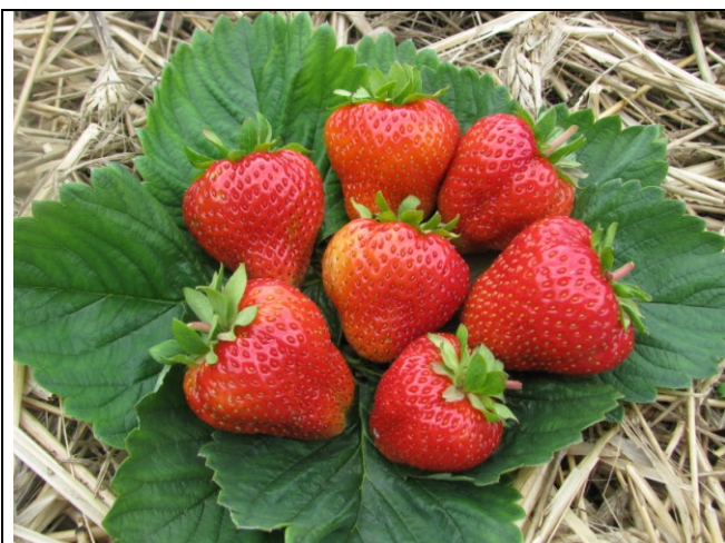
Owoce odmiany Markat (‘Marmolada’ x ‘Dukat’)