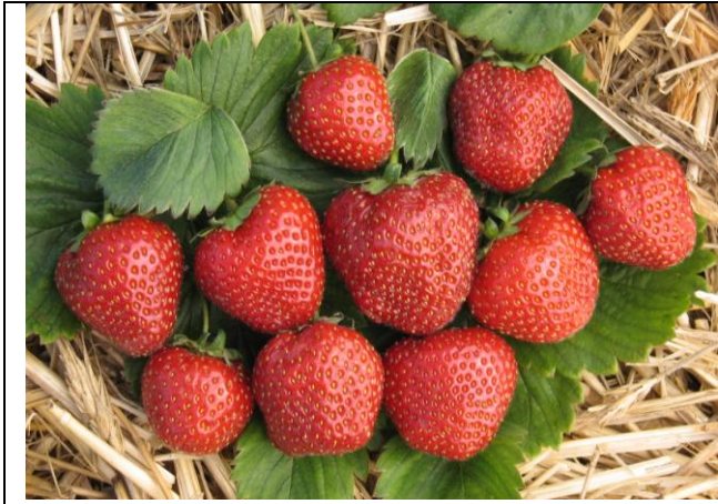
Owoce odmiany Marduk (Rodowód: 'Marmolada' x 'Dukat')