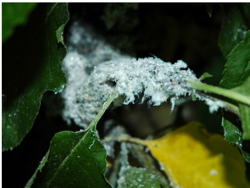
Fot. 1. Kolonia bawełnicy korówki

Mszyca często występuje na ranach powstałych np. po prześwietlaniu drzew, zasiedla naturalne spęknięcia kory, tworzy kolonie na odrostach korzeniowych i wilkach. W sadach żeruje najczęściej na pędach, ogonkach liściowych i w zagłębieniach kory na konarach oraz pniach drzew. W miejscu żerowania mszyca tworzą się wyrośla (tzw. guzy), które z czasem pękają, a przez otwarte rany łatwo wnikają różne czynniki chorobotwórcze. Na zaatakowanych młodych pędach często występują zrakowacenia uniemożliwiające rozwój pąków. Silnie zasiedlone drzewa są podatne na przemarzanie.