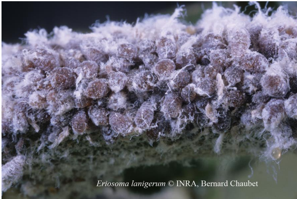
Fot. 2. Formy bezskrzydłe bawełnicy korówki