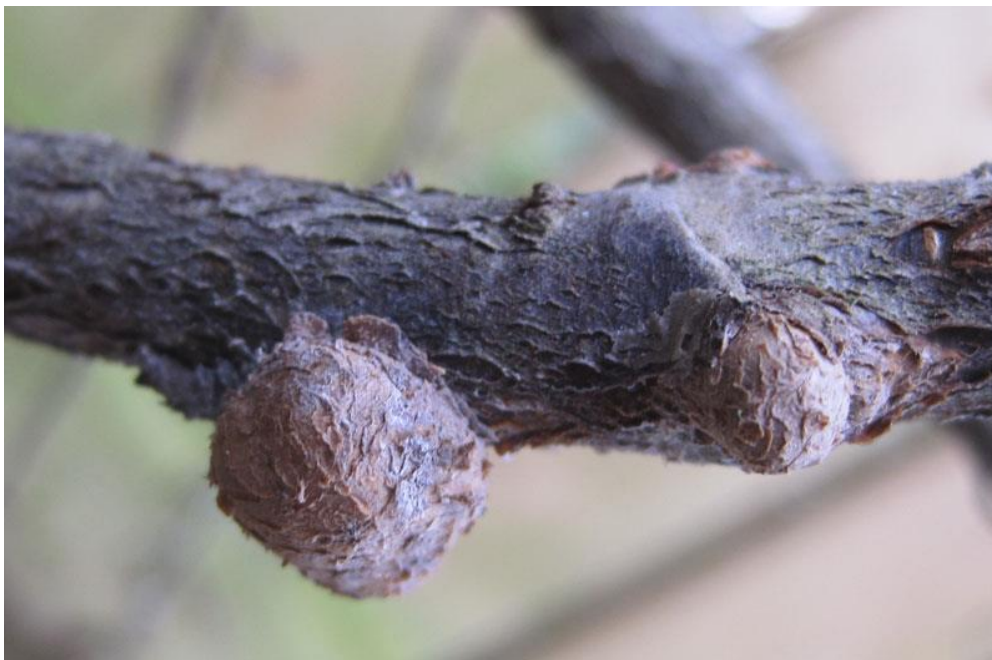
Fot. 3. Guzowate wyrośla powstałe na skutek żerowania bawełnicy

http://whitbynaturalists.co.uk/forum/2alery/166_06_10_13_7_48_05.jpeg