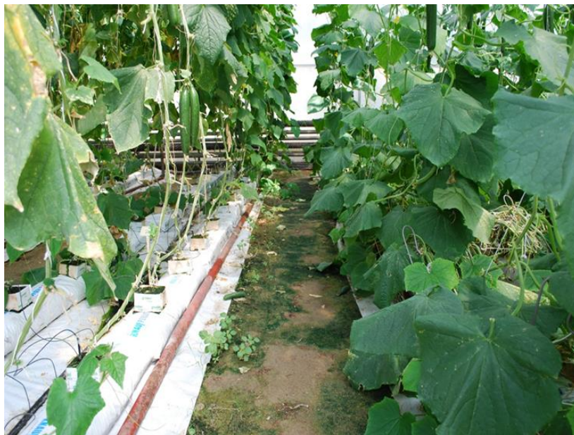
Fot. 1. Rośliny ogórka dwa tygodnie przed zakończeniem zbiorów (14 lipca 2010 r.); po prawej opuszczane, po lewej nie opuszczane Photo 1. The plants of cucumber two weeks before the end of last harvest (14 July 2010): right lowered plants, left traditional cultivation

Uzyskane wyniki analizy chemicznej liści i owoców wykazały prawidłowe odżywienie roślin. W przeprowadzonych badaniach nie stwierdzono wpływu rodzaju stosowanego podłoża uprawowego na stan odżywienia roślin ogórka.