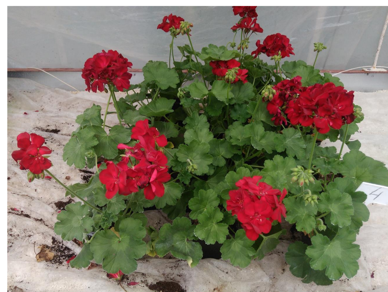
Luna Experience 500 SC