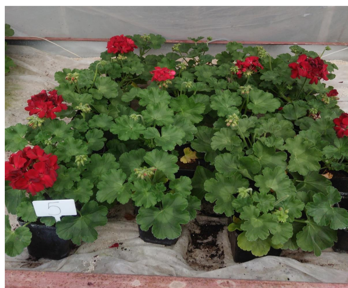
Luna Sensation 500 SC