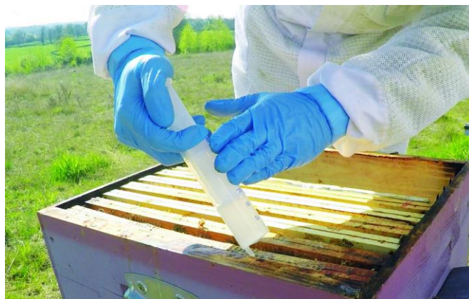
Zwalczanie warrozy preparatem zawierającym kwas szczawiowy.

zastosowaniu naturalnych pułapek na pasożyty (czerw trutowy, pszczeli) i sterowaniu czerwieniem matek w celu ograniczenia lub całkowitego wyeliminowania czerwiu w rodzinach pszczelich na czas zwalczania pasożytów.