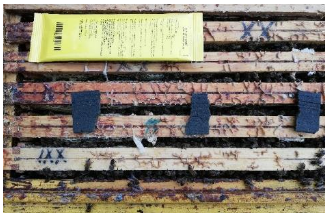
Zwalczanie warrozy preparatem zawierającym tymol

Preparaty zawierające kwas szczawiowy uchodzą za najbardziej skuteczne w zwalczaniu pasożytów, o ile zostaną zastosowane w okresie bezczerwiowym (październik- luty). Stosowanie ich latem jest mniej skuteczne z racji tego, że rodziny pszczele są liczne i wychowują dużo czerwiu. Skuteczność pogarsza również fakt, że w lecie zabójcze dla warrozy opary kwasu dość szybko ulatniają się ze środowiska ulowego, a jeśli zabieg wykonuje się w ciągu dnia, to część pszczół pracuje w polu i nie mają kontaktu z substancją aktywną preparatu. Leki zawierające tymol oraz inne olejki eteryczne działają najefektywniej, kiedy temperatura powietrza wynosi 15-25°C, dlatego stosuje się je w lecie.