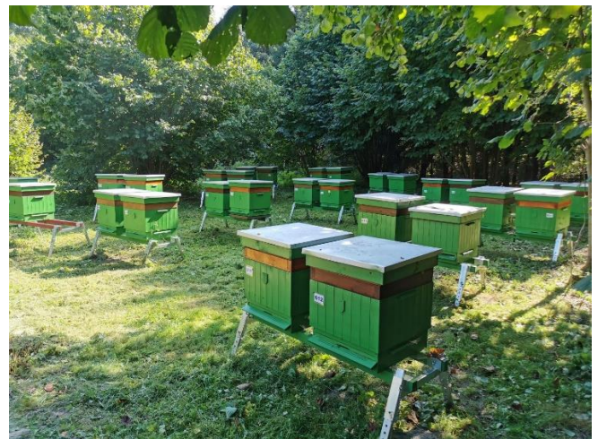
Pasieka ekologiczna Instytutu Ogrodnictwa w Poleskim Parku Narodowym