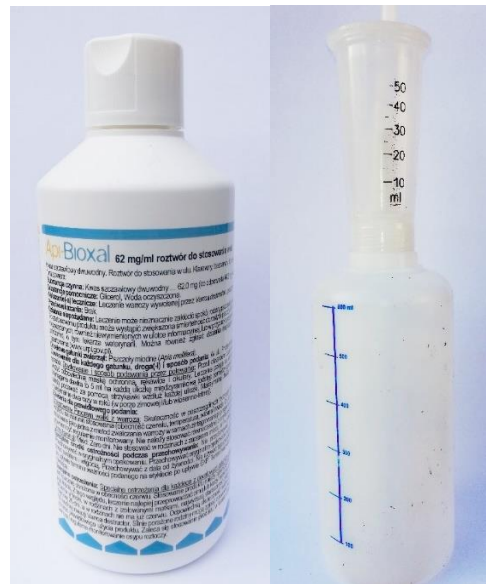
Jeden z preparatów oraz dozownik do preparatów płynnych zawierających kwas szczawiowy

W celu utrzymania porażenia pszczół na poziomie niezagrażającym egzystencji rodzin przez cały sezon pasieczny należy opracować dla pasieki zintegrowany program zwalczania pasożytów Varroa destructor , uwzględniający zarówno metody biotechniczne, jak i preparaty weterynaryjne zawierające substancje aktywne dopuszczone do stosowania w pasiekach ekologicznych. W zakładzie Pszczelnictwa Instytutu Ogrodnictwa testowane są różne strategie zwalczania pasożytów Varroa destructor . O wyborze odpowiedniego wariantu dla konkretnej powinien w pierwszej kolejności powinna decydować intensywność porażenia pszczół. Najefektywniejszym, do tej pory, rozwiązaniem do stosowania latem, po pożytku głównym było zaizolowanie matek w izolatory „Chmary” i po wygryzieniu się czerwiu jednokrotne zastosowanie preparatu zawierającego kwas szczawiowy jako substancję czynną. Średnią skuteczność takiego postępowania oceniono na 93% przy niewielkiej rozpiętości wyników 92-94%. Dla porównania skuteczność