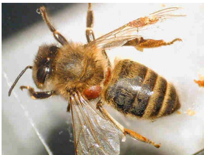
Pasożyty Varroa destructor żerujące na robotnicy

wspomagane biotechnicznymi metodami walki z pasożytem. Rozwiązania te wykorzystują biologię zarówno pasożyta jak i żywiciela. Jedną z ważniejszych metod biotechnicznych należy usuwanie czerwiu z pasożytami. Do wyboru są dwie opcje. Pierwsza: stosowanie ramki pracy w tej metodzie pułapką na pasożyty czerw trutowy i druga w której wabiącą pasożyty pułapką jest pszczeli. Drugą metodą jest spowodowanie przerwy w czerwieniu matek. Stan bez czerwiu w rodzinie można uzyskać na wiele sposobów np. poprzez tworzenie sztucznego roju lub izolowanie matek w izolatorach. Już sama izolacja matek powoduje zatrzymanie namnażanie się pasożytów, ale dla pełnego jej wykorzystania konieczne jest włączenie zwalczania farmakologicznego.