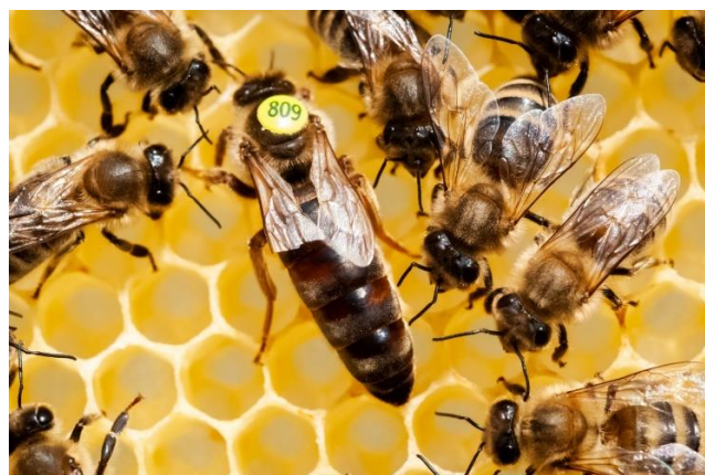
Przycinanie skrzydeł matce pszczelej jest zabronione w pasiekach ekologicznych