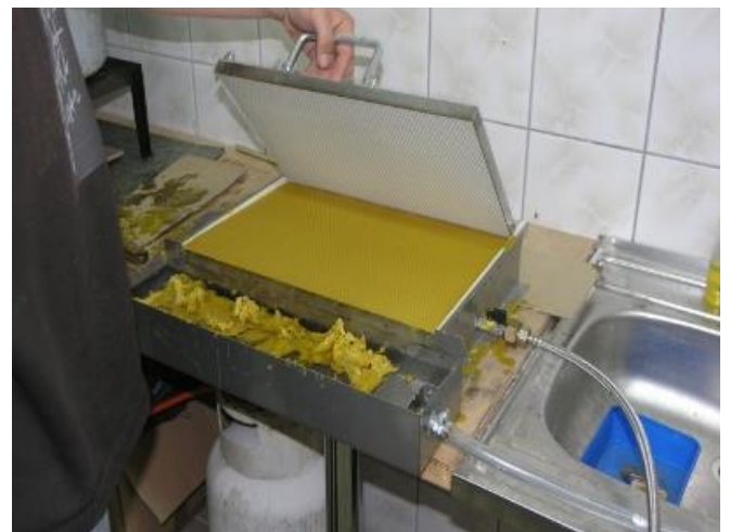
Wyrób węzy prasą z formą silikonową