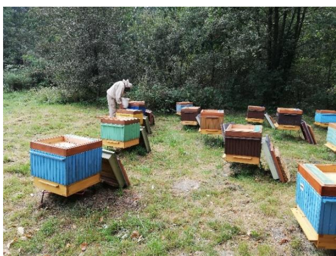
Karmienie z podkarmiaczki górnej