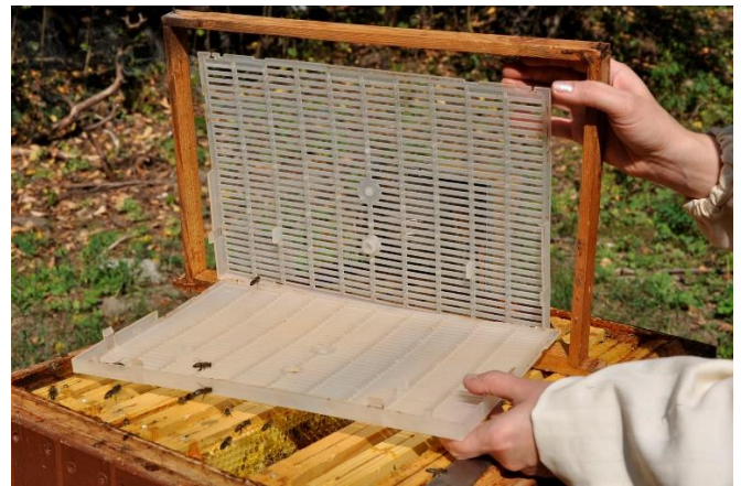
Izolator „Chmary” służący do izolowania matek pszczelich

tego samego preparatu w rodzinach z czerwiem w tym samym czasie wyniosła tylko 13%.