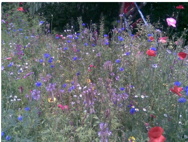
Dziko rosnące rośliny pożytkowe

Podmioty zajmujące się wytwarzaniem węzy z wosku ekologicznego powinny posiadać oddzielną linię produkcyjną i z każdej partii wosku pobrać próbę w celu ewentualnego wykonania badań w kierunku pozostałości akarycydów.