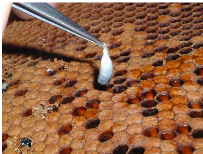
Larwa pszczela zainfekowana wirusem choroby woreczkowej

z urzędu, natychmiast przystępuje się do ich leczenia. W razie konieczności można umieścić je w izolowanych pasiekach, zwłaszcza kiedy stosuje się leczenie produktami leczniczymi, innymi niż dopuszczone do stosowania w produkcji ekologicznej. Po zakończeniu leczenia stosuje się dla takich rodzin 12 miesięczny okres przejściowy, podobnie jak w przypadku przechodzenia z produkcji konwencjonalnej na ekologiczną w celu wymiany plastrów.