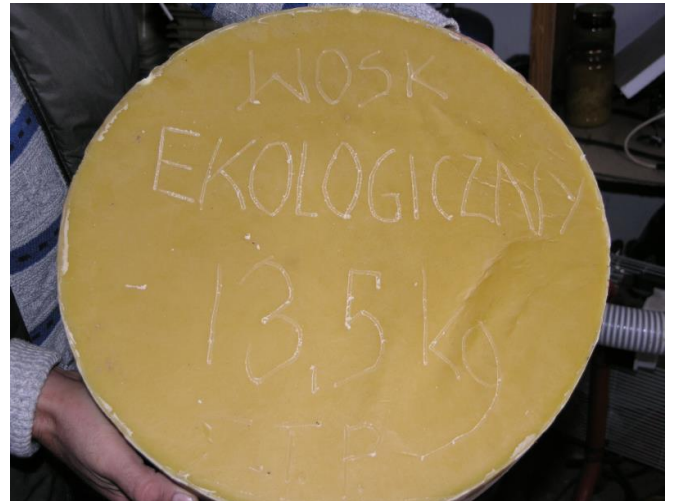
Przetopiony wosk ekologiczny