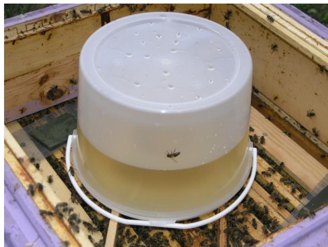
Karmienie z podkarmiaczki wiaderkowej

Na zimę pozostawia się dla pszczół jak największe zapasy miodu i pyłku wystarczające do przetrwania zimy. Ewentualny niedobór uzupełnia się syropem z cukru ekologicznego.